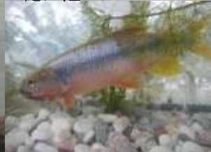
縫ノ池のヌマムツ

縫ノ池に湧き水が甦って約10年が経過しました。現在ではフナやバラタナゴ等の多くの淡水魚等も縫ノ池に戻ってきました。この度、【佐賀県立宇宙科学館】のご協力を頂き、生きもの調査と外来種（雷魚等）の駆除活動を実施する事にしました。親子のコミュニケーションの機会として地区内外を問いませんので多くの方々の参加をお待ちしています。